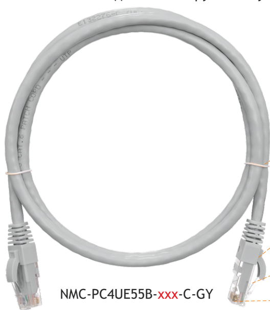
NMC-PC4UE55B- xxx -C-GY

Шнуры изготавливаются с оболочкой серого, белого, черного, красного, желтого, зеленого и синего цвета, длинами от 0,15 до 20 метров. Поставляются в индивидуальных полиэтиленовых пакетах, дополнительно объединенных в групповые упаковки по 10 штук.